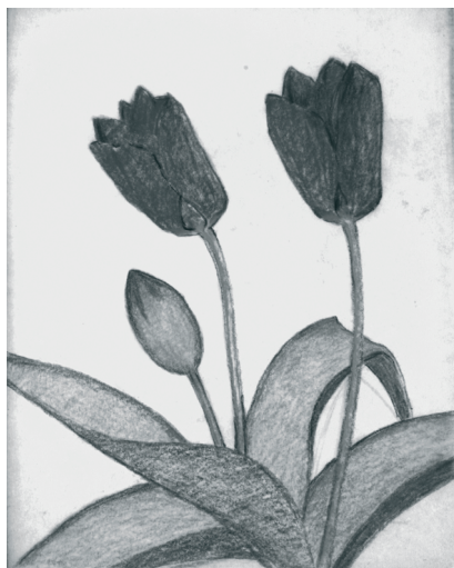
Heinrich Blunck, Zwei blühende Tulpen mit Knospe , 1960er Jahre, Pastell auf Japanpapier, Foto: UML Baldrich

Ausstellungsdauer: 18. März bis 28. Mai 2023